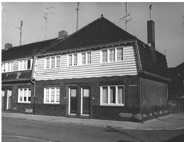
Het huis aan de Paulusstraat