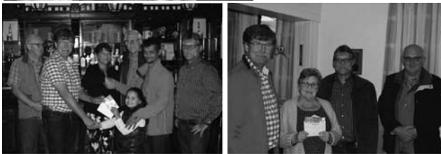
Uitreiking van de hoofdprijzen van de tombola.....

Heel veel dank aan iedereen, die -op welke wijze dan ook- zich heeft ingezet voor het welslagen van deze dag! In het bijzonder aan het wijkfeest comitee die besloten had om deze feestmiddag samen met "Leif en Leid" te organiseren. Vanwege het positieve resultaat is het de intentie om het volgend jaar op 24 juni weer een gezamenlijk feest te organiseren