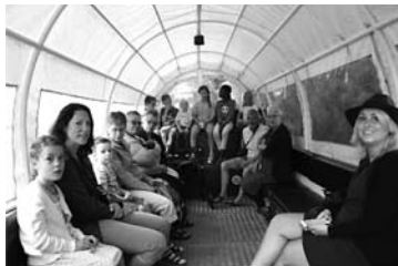
Tocht met de huifkar...