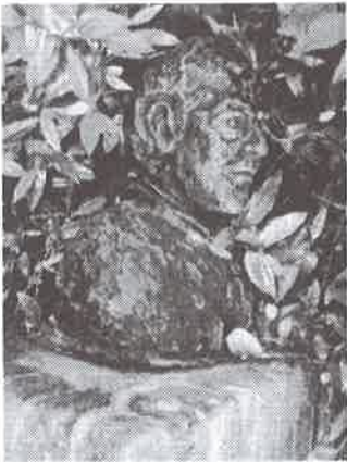
Standbeeld Pater Schreurs

Het standbeeld van Priester-dichter Jacq Schreurs MSC, geboren op 9 februari 1893 in Sittard, dat in 1983 geplaatst werd op de hoek van de Geldersestraat/ Pater Schreursstraat en op 1 juni 2006 'wreed' van de sokkel gerukt werd, wordt in de eerste helft van 2008 herplaatst. De gemeente Sittard-Geleen betaalt de kosten. Het beeld moet in de openbare ruimte herplaatst worden. Het Wijkplatform Overhoven heeft zich l.l. woensdag 16 januari beraden over de locatie. Een plek in de kloostertuin werd als mogelijkheid aangedragen. Het Wijkplatform koos voor de oude plek, met een dusdanige constructie, die herhaling van een poging tot diefstal onmogelijk maakt. Het beeld, dat na de aanslag afgevoerd werd naar een opslagplaats van de gemeente Sittard-Geleen, werd vervaardigd in het atelier van de heer Phons Brouns uit Heel. Het is op dit moment nog niet duidelijk of de massief bronzen beeltenis beschadigd is. Zou dit onverhoopt zo zijn dan is in ieder geval het in was gegoten beeld, nog in het bezit van de heer Brouns. Schreurs overleed op 31 januari 1966 in Weert. Hij was in Overhoven kapelaan tot 1937. Schreurs was een gedreven auteur.