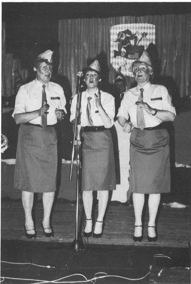
Bij dit optreden kraakte Oos Kaar in zijn voegen door het aantal decibels wat het publiek produceerde teneinde nog een „Zugabe” af te dwingen.

Het gemengd koor opende de zitting met een aantal vastelaovesleidjes, daarna volgden onder meer Leon Paes als „zèngende cowboy”, Rien Snijders met zijn buut over Pot van de Pos en niet te vergeten hét succes van de zitting: de Star Sisters (zie foto).