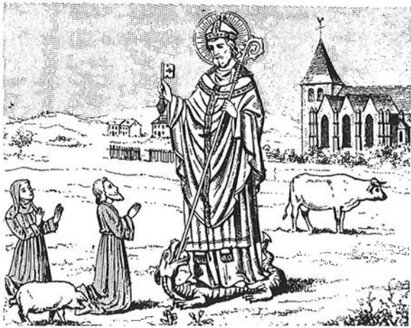
Heiligen Servatius, bisschop van Thongheren, Patroon tegen de quaelen der menschen en beesten.

Elke ziekte had zo zijn eigen heilige en elke kwaal zijn eigen middeltje. En je kon natuurlijk ook nog naar de dokter gaan, maar of die er méér van terecht bracht dan zijn gecanoniseerde collega's in de hemel, stond te bezien. Je moest ook niet zomaar een willekeurige heilige aanroepen, neen, er waren duidelijk afgebakende arbeidsterreinen. Elke heilige had zijn eigen specialiteit. Heel bekend bijvoorbeeld was de heilige Apollonia, die zich met de kiespijn bezig hield. In die tijd waren er maar weinig tandartsen in de buurt: als de pijn niet meer te harden was, trok de dokter die zere kies wel eventjes uit. Maar als Apollonia dat even regelde, was dat natuurlijk mooi meegenomen. Tegen vallende ziekte, die trouwens va-