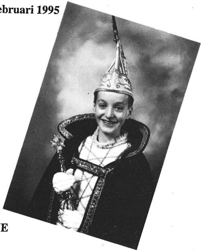
PRINSE VAN EUVERHAOVE