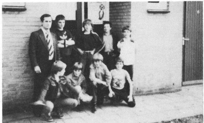
Pup. 1 reis Lille. Enkele spelers en leiders ontbreken.

Komt u uw jongens even uitwuiwen? Ondanks hun toch al stoere leeftijd, zien ze dit toch nog graag.