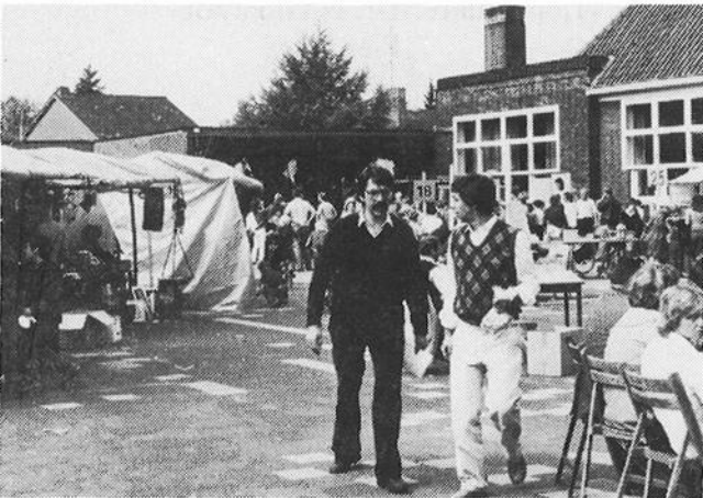
Zaterdag 24 september

Voor het definitieve eindbedrag moet u uitkijken naar het volgende Wijkblad. Verwacht wordt de somma van fl. 7.000,-! Dat hangt van uw kooplust voor onze kaarten af!