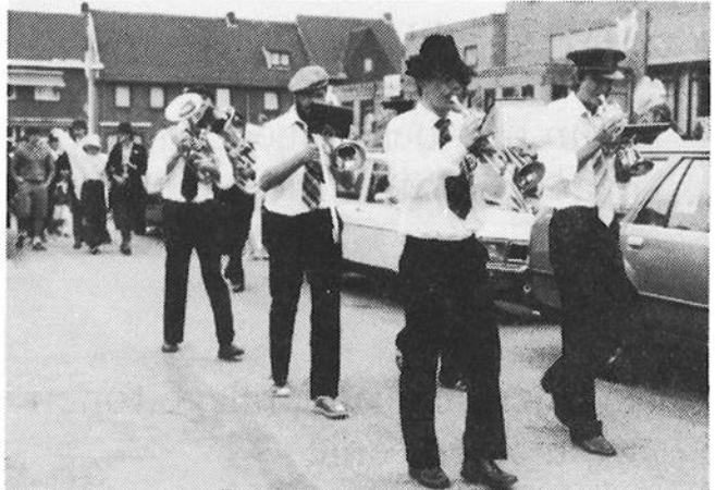
De Narre kapel voorop in de stoet van de „Boerebroelof”. Voor de eerste keer „loupe” en „blaoze” tegelijk. Dat viel niet mee!