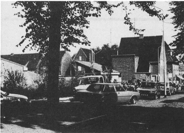
Gebruikelijk beeld bij einde schooltijd

Overigens had hij dit punt al eerder aangesneden bij de begrotingsbehandeling 1983 in januari van dit jaar. Het College heeft toen toegezegd, dat er voor voldoende parkeer ruimte zou worden gezorgd. Geconstateerd moet echter worden, dat de toename van de drukte grotere vormen heeft aangenomen dan algemeen verwacht werd. Hoe dit ook zij, vast staat, dat er momenteel volop problemen zijn.