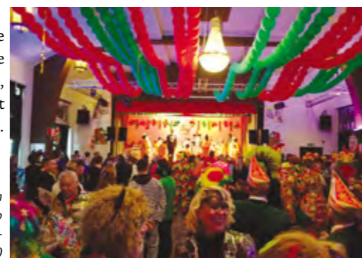
D'n Daag van Euverhaove op Vastelaoves- maondig 2020