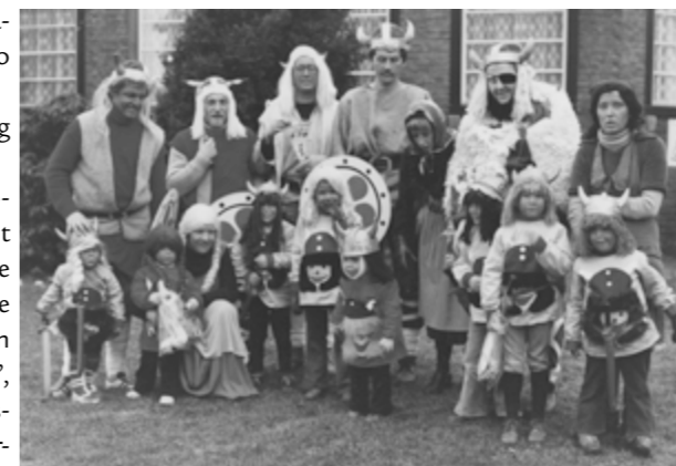
D'n eesjte optoch

De kómmende waeke zulle veer via Facebook in de lóch zeen óm zo op ein digitaal maneier get mit uch te kenne sjlachte. Ouch zou 't sjoon zeen, es geer in en óm 't hoes get kleur wilt aanbrènge óm zo te laote zeen, dat 't Vastelaovend is. Veer óngerstjeune dat mit eine Euverhaovese Narre zuiktoch :