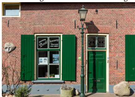
Voorbeeld van een raamluik

Vroeger waren blinden het enige middel om te voorkomen dat weer en wind tot in de woning voelbaar waren. Vensterglas