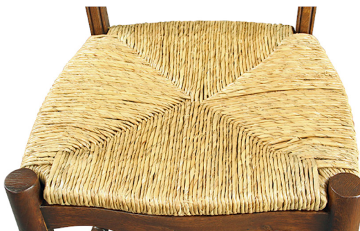
Een biezen stoelzitting

Voordat we met Thei Adams gaan praten, eerst een stukje geschiedenis over het ontstaan van vloerbedekking in Nederland. Ook de wijze waarop de mensen hun huizen vroeger en nu beschermen tegen zon, licht, en andere weersinvloeden van buitenaf, komt in het kort aan bod.