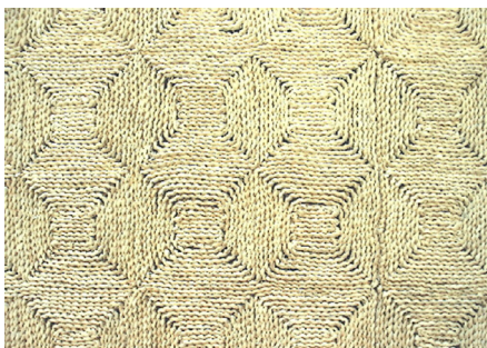
De Genemuider mat

Vanaf de 16e eeuw werd in Genemuiden de biezeenteelt beoefend. Bies is een dun, lang oevergewas. Vooral het vervaardigen van biezen stoelzittingen (door stoelelmatters) was een belangrijke activiteit. Omstreeks 1910 begon men met de vervaardiging van biezenmatten, waaronder karpetten en lopers. Het meest bekend was de blokmat of Genemuider mat.