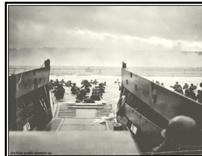
Archive public domain us