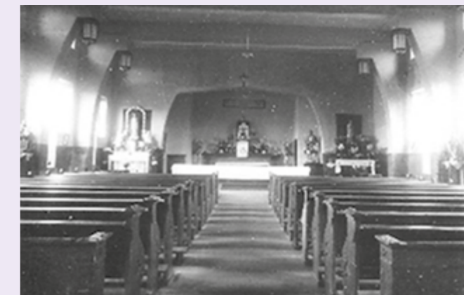
Noodkerk Overhoven

In 1923 begon een nieuw hoofdstuk in Overhoven. Men was niet alleen aangewezen op de St. Petruskerk, maar een nieuwe 'parochie'gemeenschap begon: onder het wakend oog van deken Thijssen. Op zondag 25 juni om 11.00 uur herdenken we dit met een feestelijke Eucharistieviering in onze kerk. In het kerkregister is veel vastgelegd over de 100 jaar, die we nu gaan vieren. U krijgt hierover nog meer te horen in het volgende wijkblad. Houd dit wijkblad, het parochieblad, maar ook onze website